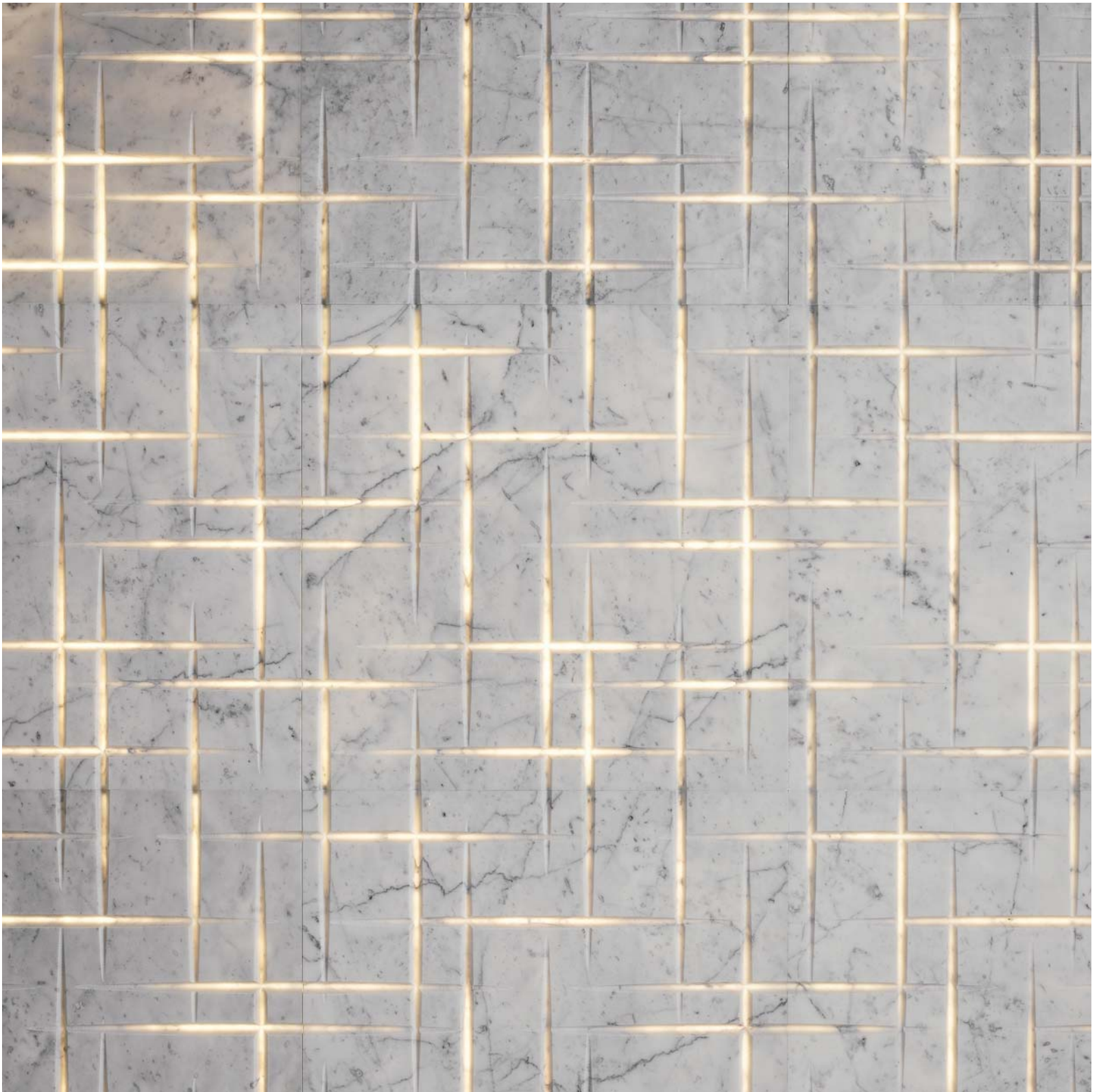
Hamal in carrara ghiaccio