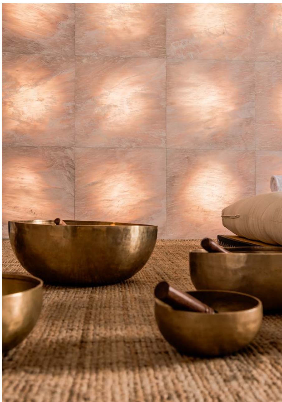
Sole in rosa egeo

Un rivestimento retroilluminato in marmo dall'effetto luminoso sfumato e graduale grazie a una lavorazione della pietra che, per la prima volta, viene eseguita solo sul retro della marmetta intensificando così l'effetto sorpresa della luce sulla superficie liscia frontale.