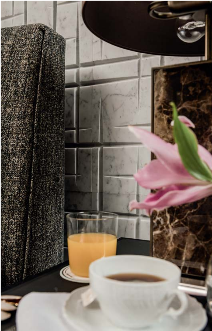
Hamal in carrara ghiaccio