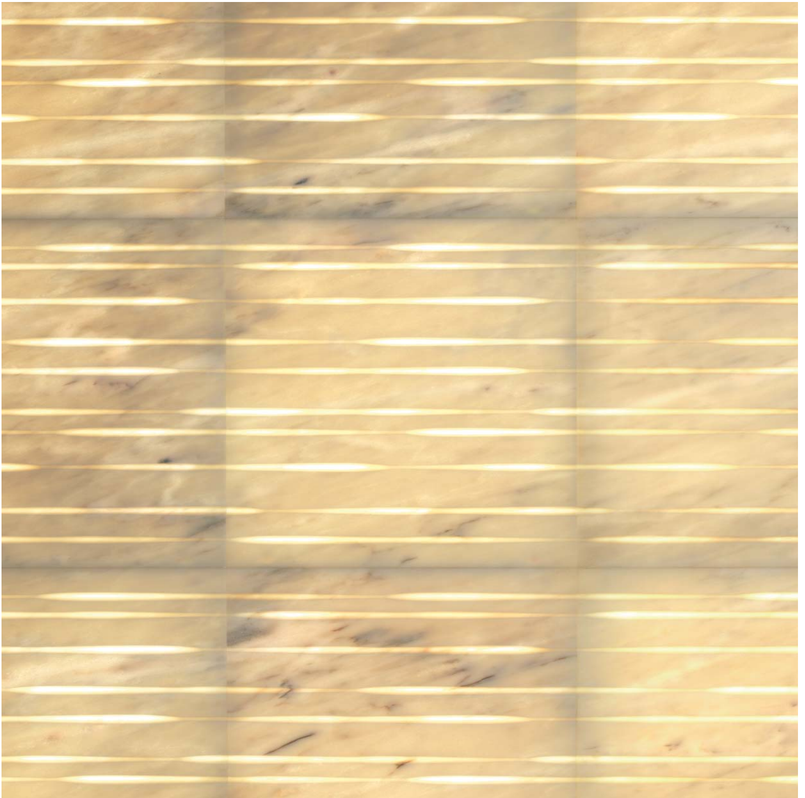
Mizar in estremo