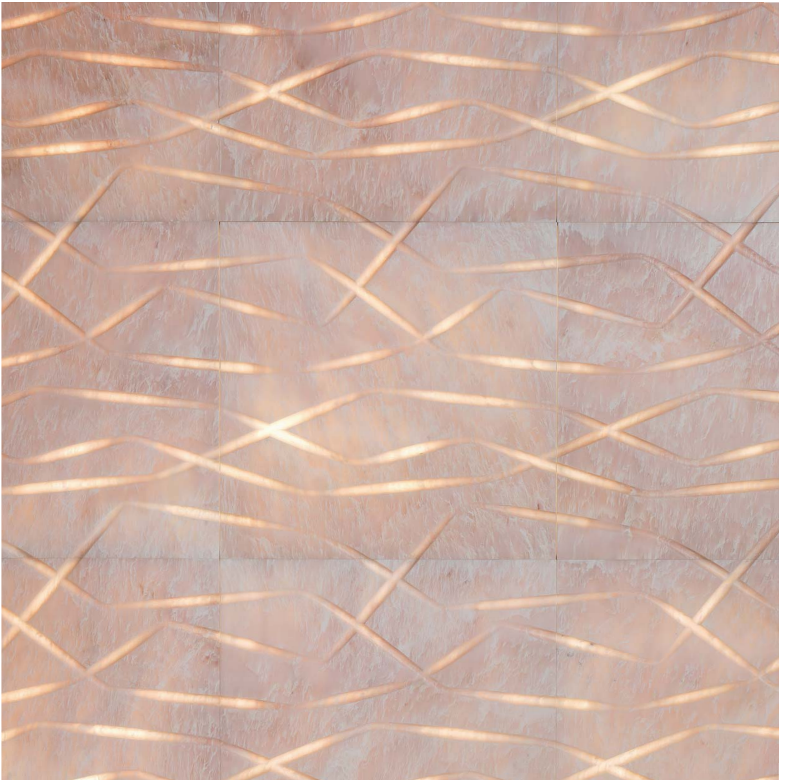
Vega in rosa egeo