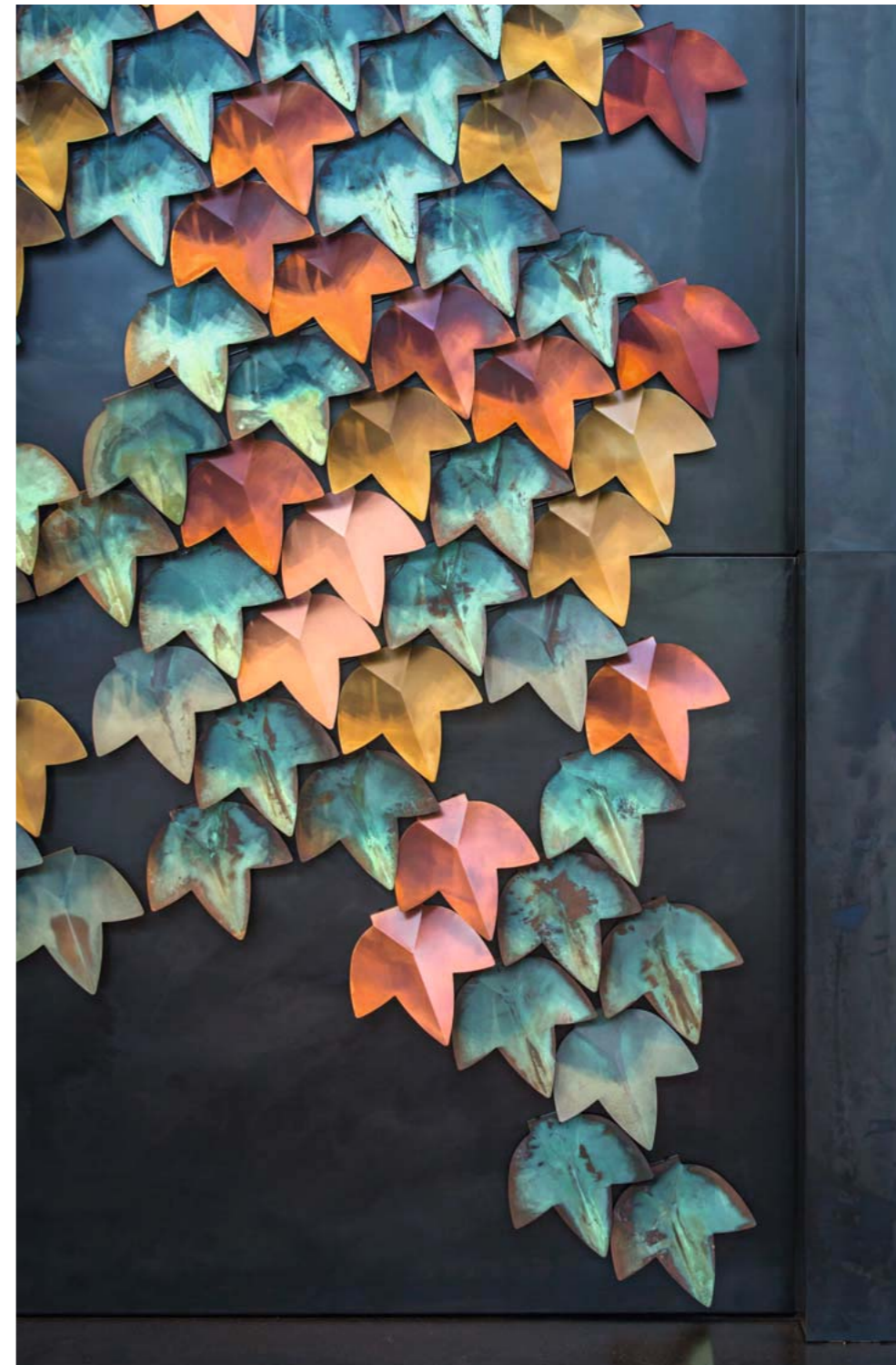
Vertical Green Standard finishes composition