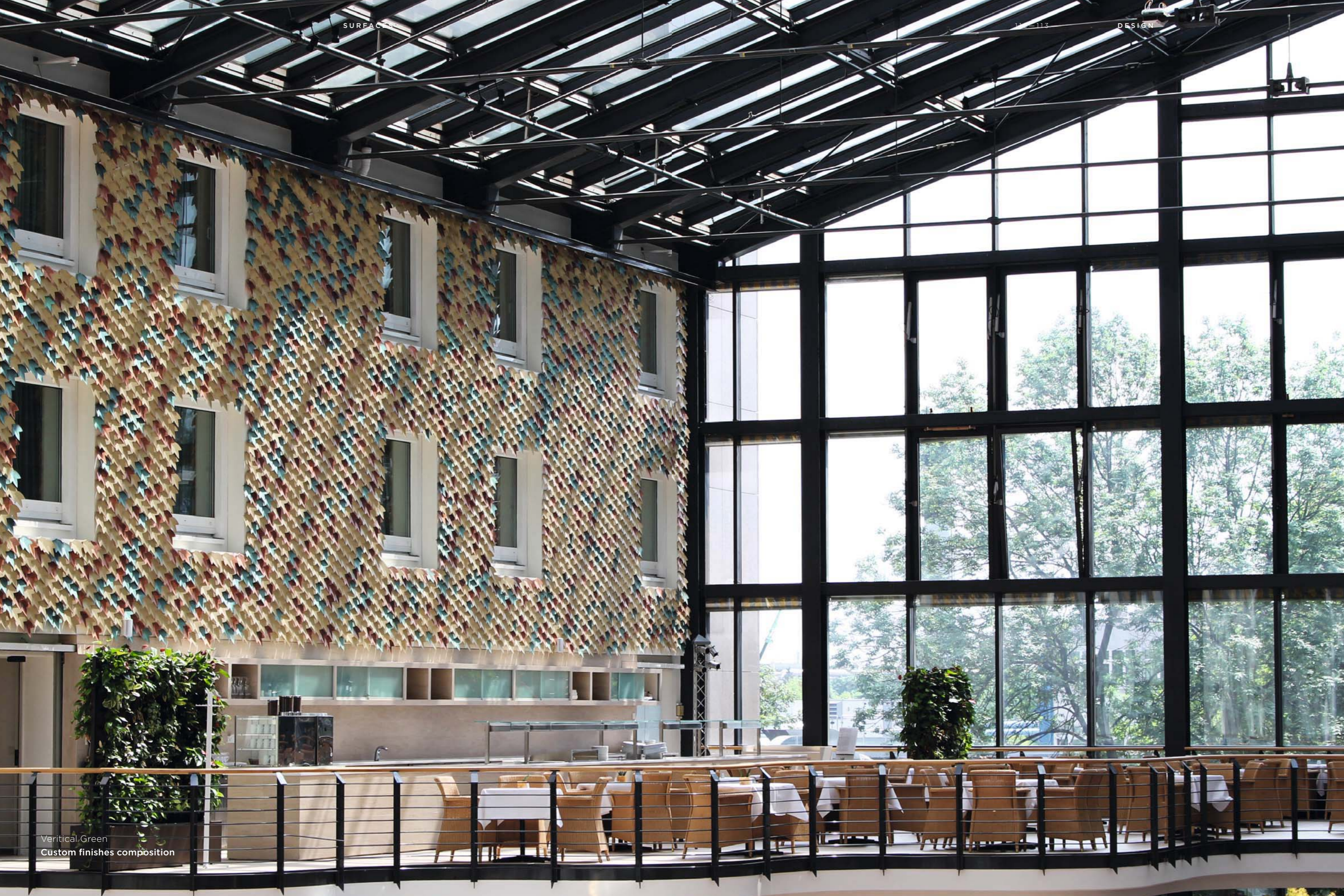
Vertical Green Custom finishes composition